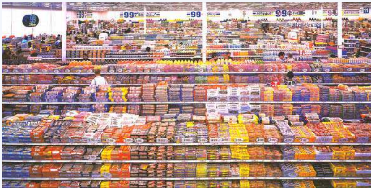
Andreas Gursky, 99 Cent (1999)